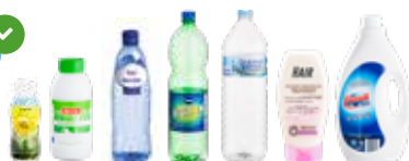
PLASTIC FLESSEN & FLACONS