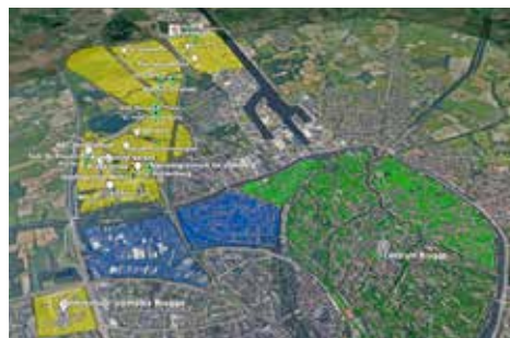
De gele zones tonen het huidige warmtenet. IVBO wil het warmtenet uitbreiden richting het historisch centrum.

Vanaf volgend jaar zal de hoofdader vernieuwd en uitgebreid worden. Het doortrekken van het net tot aan de rand van de historische binnenstad van Brugge ligt op de tekentafels en krijgt vorm. Op deze manier verzekeren we onze klanten dat ze voor minstens nóg eens 40 jaar van onze duurzame warmte kunnen genieten.